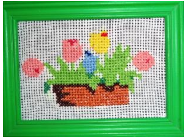
Przemysław Maziński kl. V b