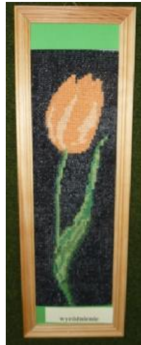
Iza Sobolewska kl. V b