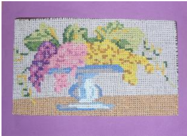
Justyna Bilewicz kl. IV b